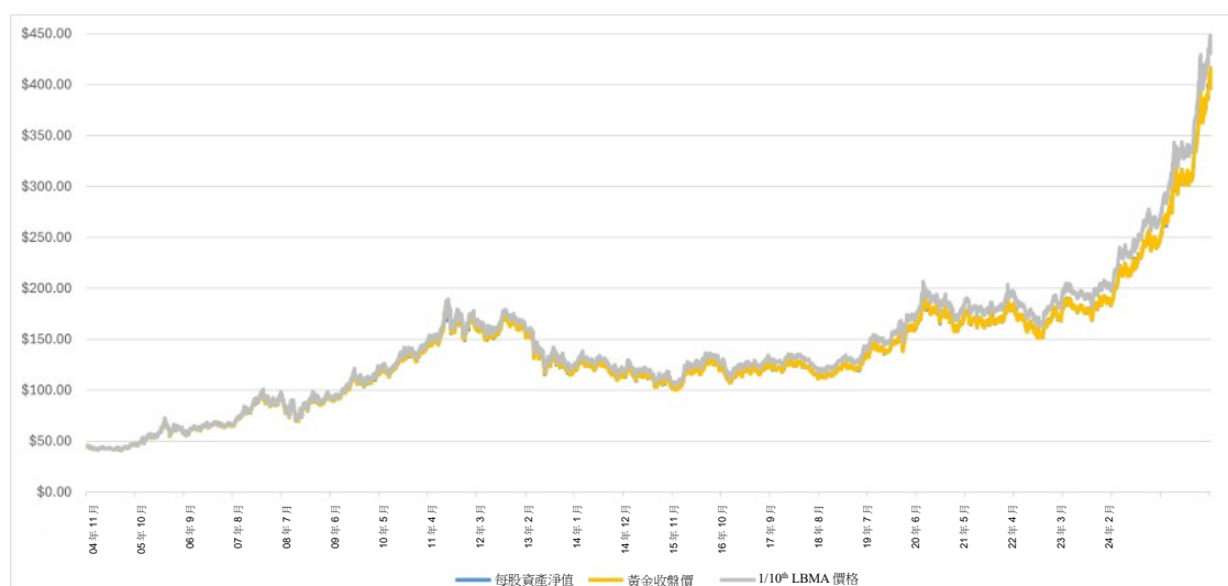
2004年11月18日至2025年12月31日股價及股份資產淨值（以美元計值）相對於相應金價的變動

下圖提供黃金價格的歷史背景。圖表根據前黃金定價基準倫敦下午定價（定義見下文，之後於2015年3月20日被LBMA倫敦時間下午三時正的黃金價格（「LBMA下午黃金價格」）取代）為基準，闡明由2004年11月18日股份開始在紐約交易所買賣之日起至2025年12月31日期間每股資產淨值（以美元計值，雖然採納多櫃台）相較於每盎司美元黃金價格變動的變化。倫敦黃金市場定價有限公司（London Gold Market Fixing Limited）過去一直在倫敦交易時段公佈定價，為當日交易提供參考金價（「倫敦定價」）。市場參與者在估值時通常會參照上午(AM)或下午(PM)倫敦定價（「倫敦下午定價」）作為基準。